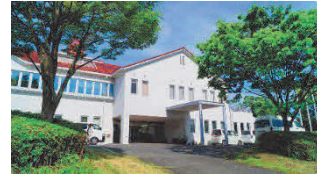
神港園あむせの家