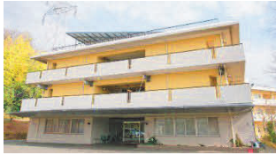
孤児老人ホーム神港園