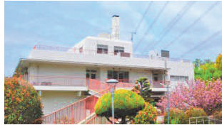
神港園シルビアホーム