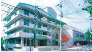
神港園サニーライフ白川