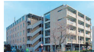
神港園レインボー酒殿通