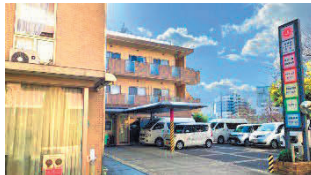
神港園レインボー西宮