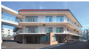
さん舞子神港園いこの家