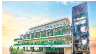
神港園サニープラザ妙法寺